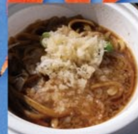
つゆ焼きそば (黒石市)