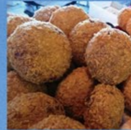
海軍コロケ (むつ市)