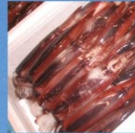
鮮魚・貝類販売 (三沢産)