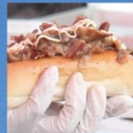
バラ焼き (商工会青年部)