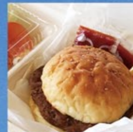
エアフォースバーガー (道の駅みさわ)