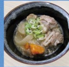
ハイカ鍋 豚バラ軟骨 (畜産公社)